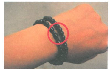
磁気ブレスレット