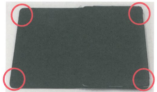
タブレットカバー